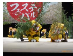
虎舞フェスティバル