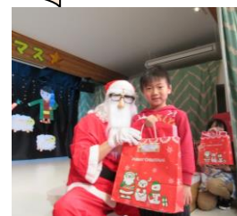
サンタさん来たよ