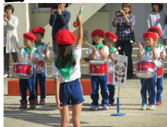
鼓笛隊がんばったよ