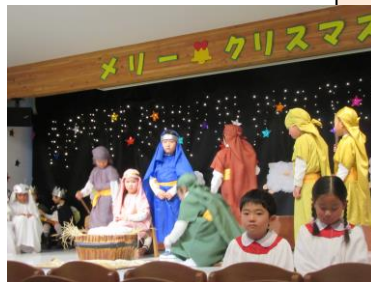
クリスマスキャロル