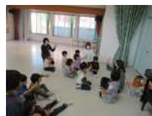
イングリッシュタイム