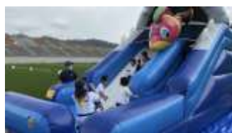
鞠住居復興スタジアムにて ハッピースマイルデー