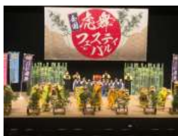
TETTO にて 虎舞披露