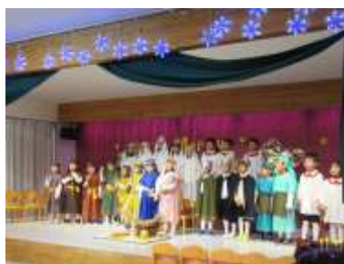
クリスマス聖誕劇