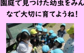
園庭で見つけた幼虫をみんな で大切に育てようね!