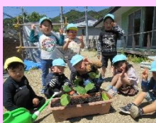
ナスとピーマンを みんなで植えたよ