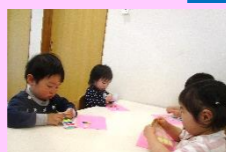
ペタペタシール遊び楽しいな♡