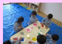
ペタペタぬりぬり きれいだね!