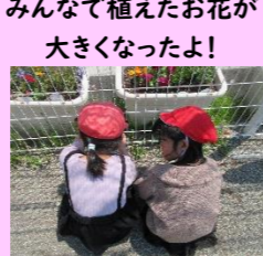
みんなで植えたお花が 大きくなったよ!