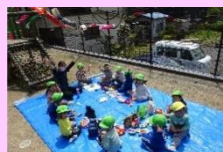
お外でお弁当楽しいね♡