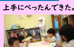
上手にべったんできたよ!!