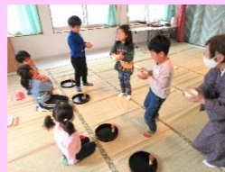
自分で点てたお茶を お友だちに飲んでもらうよ!