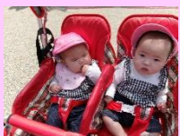
園庭をお散歩したりお部屋で遊んだよ!