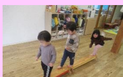
バランスを取りながら 上手に歩けるよ!