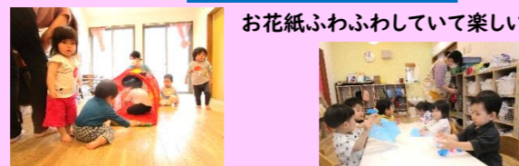
トンネルでたくさん体を動かしたよ!