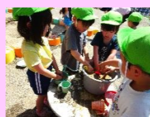
泥遊びに夢中な子ども達