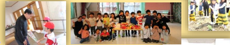
いつもありがとうございます