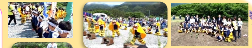
虎舞かっこよく踊れたよ!!

釜石市×ロクシタン定植イベントに虎舞で参加しました。ラベンダーを釜石市野田市長やロクシタン木島社長、保護者の方々と一緒に定植しました!