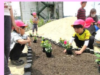
園庭がきれいになって嬉しいな