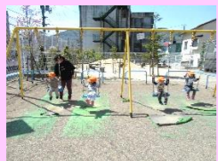
ブランコに揺られて気持ちいいな