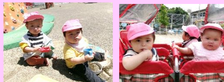
お砂場で遊んだり、散歩もしたりしたよ