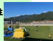
アウトレジャーの大型すべり台も楽しみました!