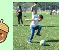
サッカー楽しいね