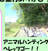
アニマルハンティングハレツゴー!!

継続的な「森づくり活動」を通じて幼児期の子ども達に自然と環境の提供し「生きる力」「環境の心」を育むことを目指す全国運動です。どんぐりを拾う予定でしたが、どんぐりが少ない…。どんぐりは諦めて、山の中で「アニマルハンティング」を楽しみました