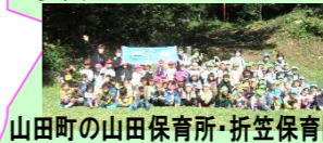
山田町の山田保育所・折笠保育園・とよまねこども園・大槌町のつつみこども園のお友達と一緒に楽しみました!