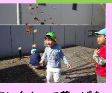
空に向かって葉っぱを投げるときれいだね!