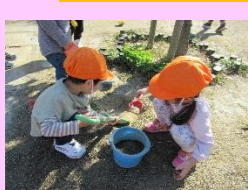
雨で出来た水たまり! 砂を入れるとどうなるかな?