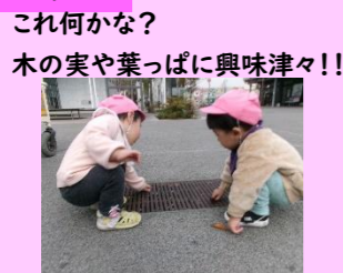
これ何かな? 木の葉や葉っぱに興味津々!!