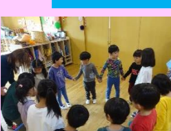
ゲーム遊びをしたよ! みんなで遊ぶと楽しいね♪