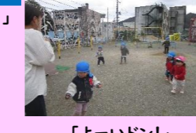
「よーいドン!」 みんなでかけっこ楽しいな♪