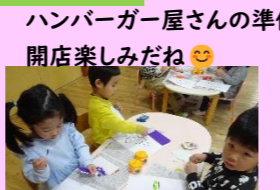
ハンバーガー屋さんの準備! 開店楽しみだね!