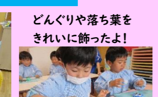
どんぐりや落ち葉をきれいに飾ったよ!