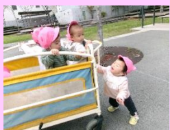
お散歩に出掛けたよ♪