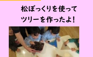
松ぼっくりを使って ツリーを作ったよ!