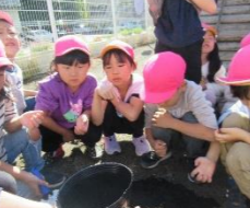
どんぐりを植えたよ。 みんなで名前をつけました!