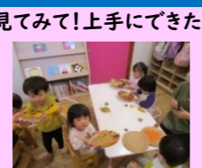
落ち葉でリースを作ったよ!