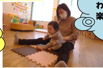
お母さんと一緒にわらべうた遊びを楽しみました!