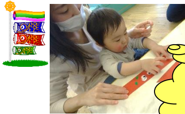
こいのぼり作ろう!