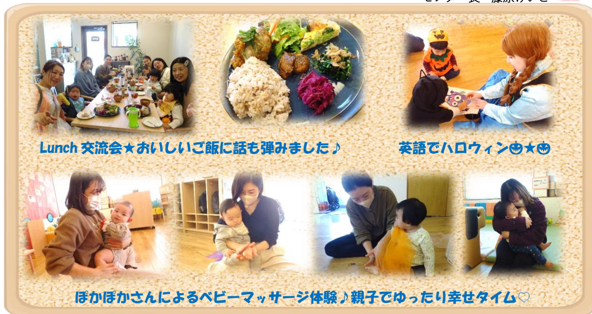
Lunch 交流会★おいしいご飯に話も弾みました♪