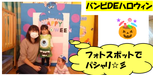
バンビDEハロウィン